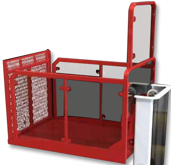
Sollevatore mobile da treno Portable train Lift